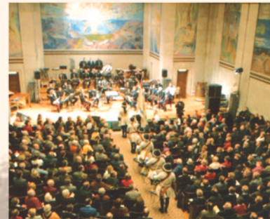
Universitetets Aula Oslo 30. januar 2002.

Oppstilling på Place d'Armes ved Kongsten Fort KK 1999.