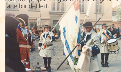
Avdelingsfanen vår ble avduket på torget i Festningsbyen under KK 30. mai 1997.

I felten hadde fanebæreren et stående krav om at hvis retrett var umulig, skulle han rulle seg inn i fanen for å beskytte den med sitt liv . Fane, trommer, pauker og signalhorn var trofeer for den seirende part i en strid. Fanetropp fremførte vi første gang da avdelingsfanen ble avduket og overlevert avdelingen under "1704 Kongen Kommer!" arrangementet på torget i Festningsbyen 30. mai 1997 . Avdelingsfanen er laget av Oberofiser Carl Henrik Amundsen 1997. Fanetropp spilles også når vår Regimentsfane blir defilert.