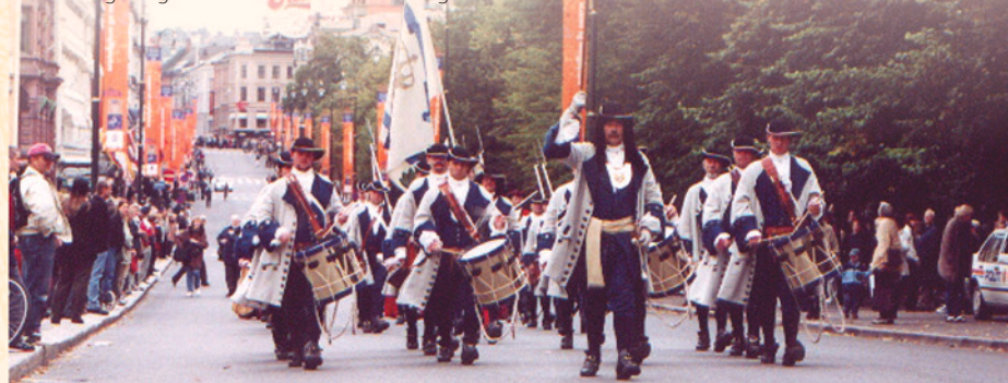
Parade på Carl Johan i Oslo før NMT 8. september 2000.

La National medvirket i vårt Tattoo program som inngikk i Forsvarets arrangement: Gardens Dag i Husebyleieren Oslo 14. juni 1998, Norwegian Military Tattoo 11. og 12. september 1998 i Oslo Spektrum, Krigsskolens 250 års jubileum på Linderud i Oslo 18. juni 2000 sammen med H.M.K. Garde, Norwegian Military Tattoo 8. og 9. september 2000 i Oslo Spektrum og sist men ikke minst ved Kronprinsbryllupet 25. august 2001 på Slottsplassen, hvor vi da var plukket ut til å representere De frivillige organisasjoner gjennom Norsk Musikkråd sentralt. Kronprins- bryllupet ble TV overført til inn – og utland.