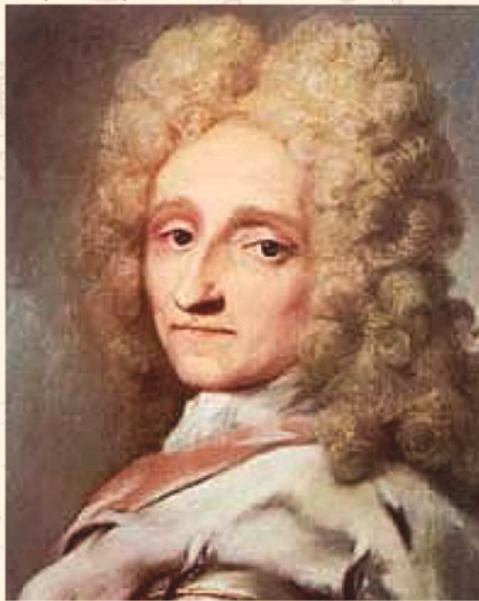
Kong Frederik IV 1671 – 1730. Konge av Danmark-Norge 1699 – 1730.

Kongens valgspråk var: HERREN ER MIN HJELPER