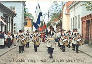
KFT Under marsj i Festningsbyen våren 1997

Piberen spilte under marsj, enkelte signaler og under seremoniell som avhenting av avdelingsfanen, flaggheis og når kongen kom. I tillegg spilte Haoutboistene , som også kunne bestå av Skalmeieblåsere, Oboister, Paukeslager og Signalhornister , ved festlige anledninger hos Regimentssjefen. Det var også han som beskostet instrumentene og lønnet den delen av mannskapet.