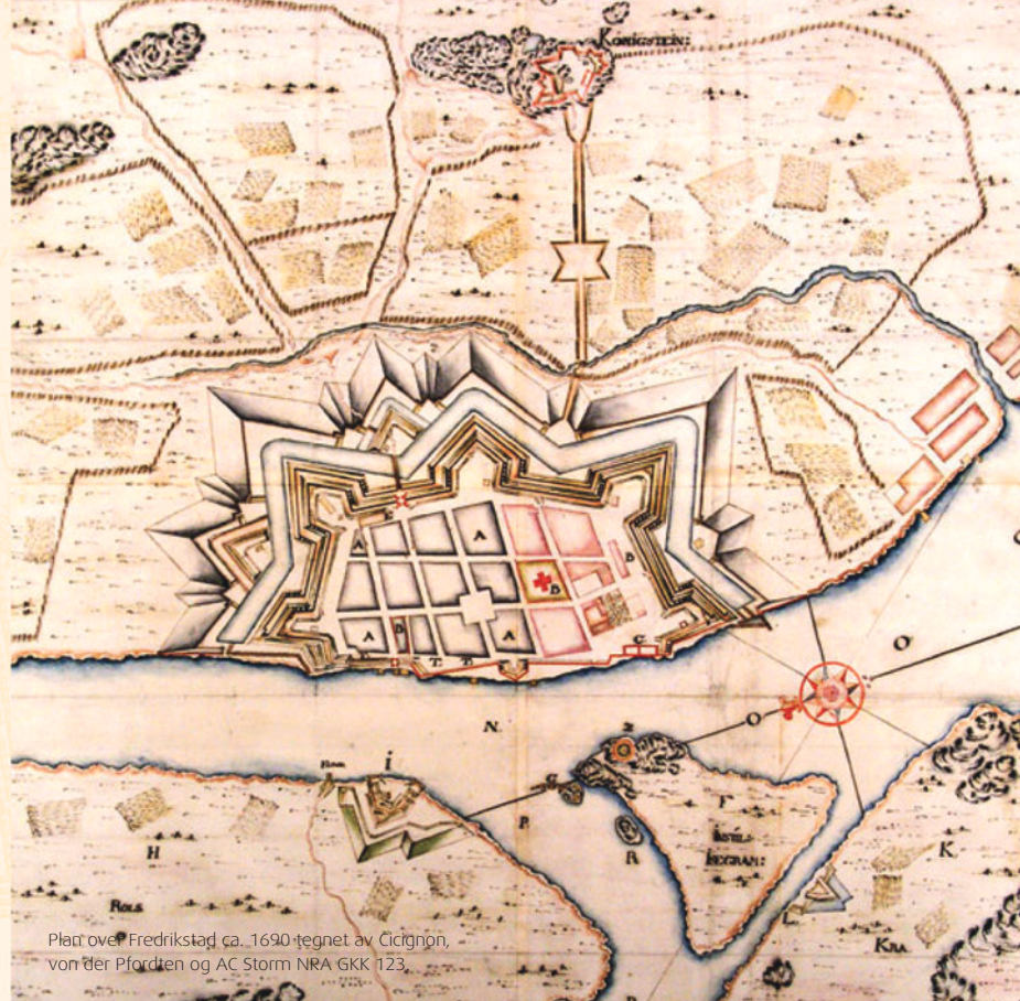
Plan over Fredrikstad ca. 1690 tegnet av Cicignon, von der Pfordten og AC Storm NRA GKK 123.

Innspillingen er redigert av lydtekniker Morten Hansen i Hænsens Lydstudio Fredrikstad våren 2005. Kilde: Trommeslåtter – En Trommeslagers Skattekiste. En presentasjon og videreføring av trommeslåtter fra Johannes Sundvors samlinger. Av Carl Haakon Waadeland (TIMA Forlag 1995).