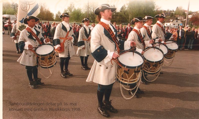
Tambourafdelingen deltar på 16. mai konsert med Greaker Musikkorps 1998.