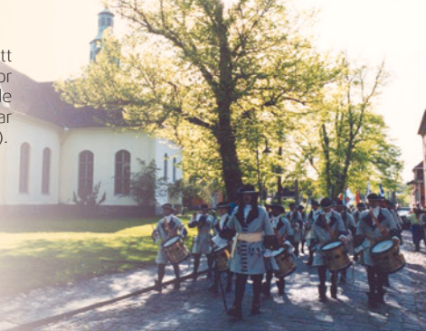
KFT ved Østre Fredrikstad Kirke i Festningsbyen

Det er denne noten vi har brukt på vår innspilling.