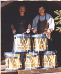
Tromme overlevering 4. april 1997